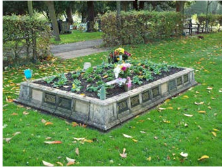
Gerddi Coffa y Gorllewin 1 a 2

Mae mynwent y gorllewin yn cynnig dau fath gwahanol o blac coffa gwenithfaen. Nodwch yr opsiwn sydd orau gennych.