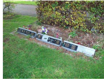
Gardd Goffa y Gorllewin 3